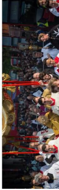
Organised by the Westminster Diocesan Parishnet of Maiden Lane, Warwick Street & Spanish Place, with the Ukrainian Cathedral & the Order of Malta