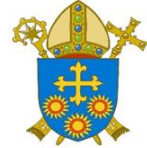
Diocese of Brentwood