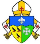
Archdiocese of Southwark