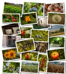
Kalendár 2024 SLOVENSKÁ KATOLICKÁ MISIA V LONDÝNE SLOVAK CATHOLIC MISSION IN LONDON

Slovenská katolícka misia v Londýne vydala – ako každý rok – nástenný kalendár, ktorý je teraz k dispozícii pre záujemcov. Nástenný kalendár je nepredajný, odporúča sa príspevok na pokrytie nákladov na výrobu kalendára (£ 8).