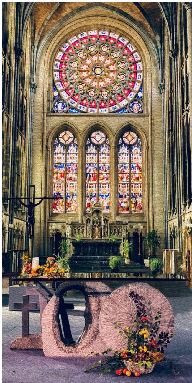
Obetný oltár zo sanktuária kostola sv. Martina z Tours v meste Arlon, Belgicko