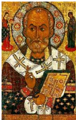
Aleksa Petrov: sv. Mikuláš, ruská ikona, 1294

Atribúty: odev biskupa, tri mešce peňazí, tri chleby, tri jablká, tri kamene, loď, kormidlo, kotva Patrón detí, pekárov, námorníkov, majiteľov záložní, lekárníkov, rybárov