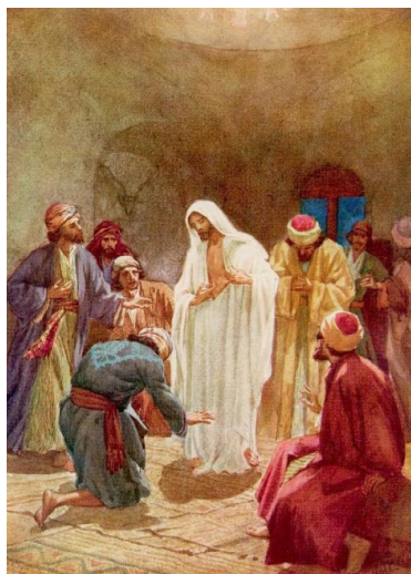
O osem dní prišiel Ježiš

Večer v ten istý prvý deň v týždni, keď boli učeníci zo strachu pred Židmi zhromaždení za zatvorenými dverami, prišiel Ježiš, stal si doprostred a povedal im: „Pokoj vám!“ Ako to povedal, ukázal im ruky a bok. Učeníci sa zaradovali, keď videli Pána.